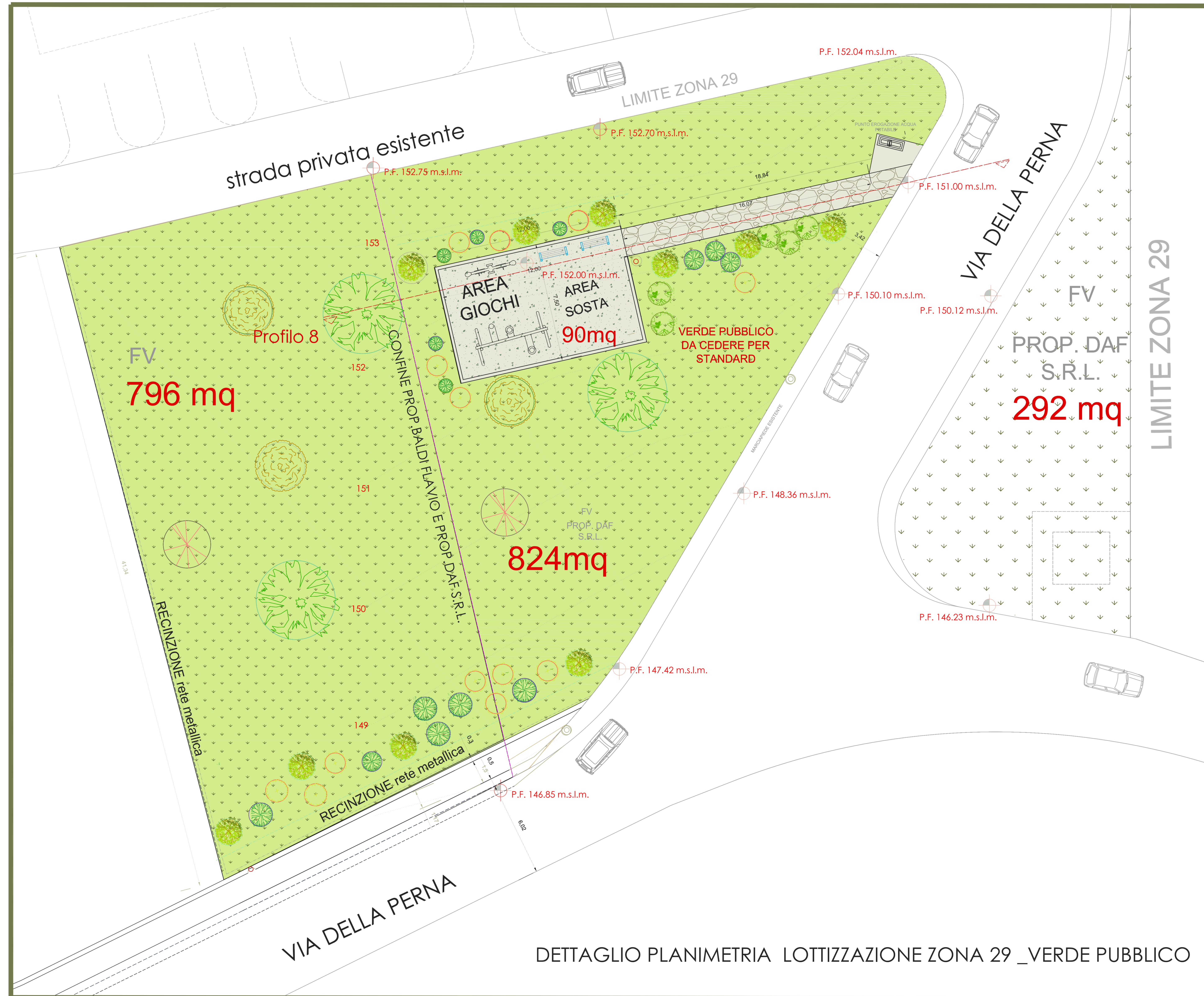
DETTAGLIO PLANIMETRIA LOTTIZZAZIONE ZONA 29 _VERDE PUBBLICO